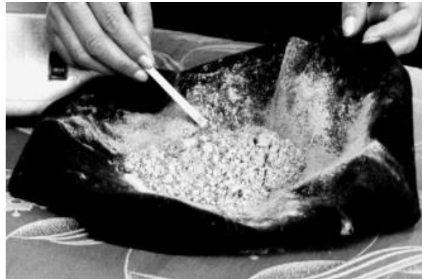
Schmutz aus einer Matratze

Untersuchungen haben ergeben, dass mehr als 98 % aller Matratzen verschmutzt sind und Milbenkot enthalten. In jeder Matratze leben bis zu 2 Mio. Milben. Diese produzieren täglich Milbenkot, der allergieauslösende Bestandteile enthält. Eine Hausstaubmilbe produziert ca. 20 Kotkugeln am Tag. In ihrem ca. sechswöchigen Leben summiert sich das Gewicht der Kotbällchen auf das 200-fache des Eigengewichts der Milbe.