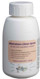
Matratzen Clean Nachfüllflasche