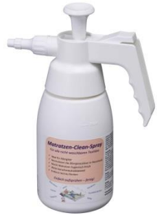
Matratzen Clean Spray

Matratzen Clean - bewährt seit mehr als 25 Jahren!