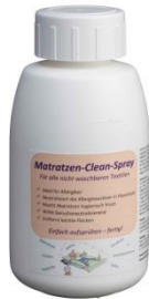
Matratzen Clean Nachfüllflasche