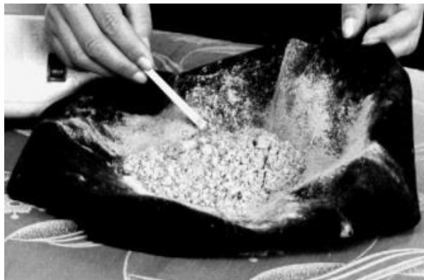
Schmutz aus einer Matratze

Untersuchungen haben ergeben, dass mehr als 98 % aller Matratzen verschmutzt sind und Milbenkot enthalten. In jeder Matratze leben bis zu 2 Mio. Milben. Diese produzieren täglich Milbenkot, der allergieauslösende Bestandteile enthält. Eine Hausstaubmilbe produziert ca. 20 Kotkugeln am Tag. In ihrem ca. sechswöchigen Leben summiert sich das Gewicht der Kotbällchen auf das 200-fache des Eigengewichts der Milbe.